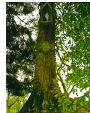
Chêne à la Vierge

13 Le hêtre de l'Épinette. A partir de la source, reprendre le chemin vers l'est jusqu'à la route forestière de l'Épinette. Prendre à droite sur 100 mètres puis, à gauche, le chemin qui sépare les parcelles 46 et 47. L'arbre est situé 100 mètres plus bas à gauche. Ce hêtre montre un tronc très fort et très élevé, mais son houppier est complètement atrophié, ce qui compromet gravement sa longévité.