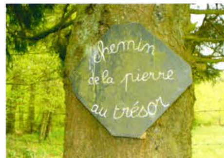
Chemin de la pierre au trésor

9 Prieuré Saint-Ortaire. Le village du Bas Bézier est habité et animé par les frères Servites de Marie qui disposent de deux chapelles, un oratoire, un jardin de prière avec chemin de croix dans le style d'un cloître de verdure et une hôtellerie avec salles de réunion. Deux maisons d'habitation et un modeste corps de ferme complètent ce pittoresque village qui perpétue l'histoire et les légendes de Saint Ortaire et de Sainte Radegonde.