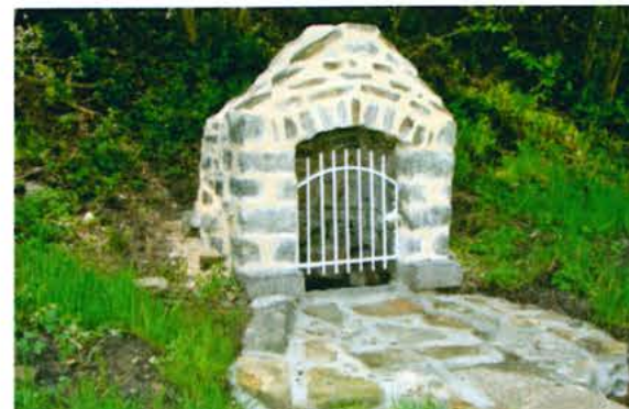
Fontaine de Saint Ortaire