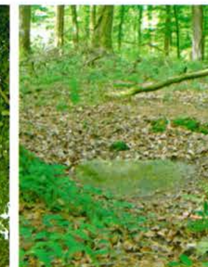
Pierre au trésor